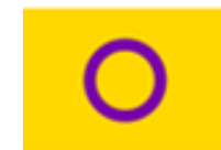
Drapeau de la fierté intersexe