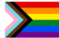
Drapeau de la fierté du progrès