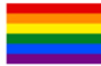
Drapeau LGBT traditionnel