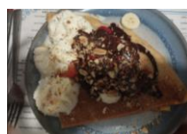
22/05, 12/06, 26/06 Grenier à Crêpes