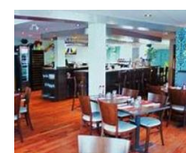
21 août Rest'ô Zénith