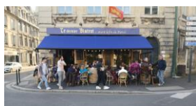
15/05, 17/07, 28/08 Dernier Bistrot Avant La Fin Du Monde