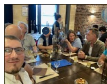
24/07 Le Sans Gêne