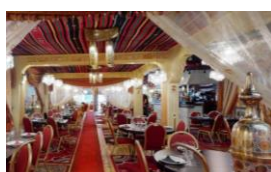
19/06 Le Libanais