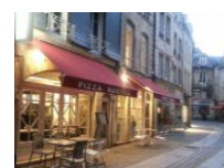
29/05, 3/07, 14/08 Rustica