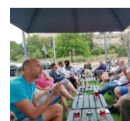
7/08 Le Multiverre