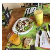
5/06, 31/07 Salad and Co