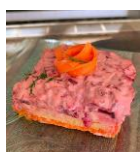
8/05, 10/07 Au Rendez-Vous